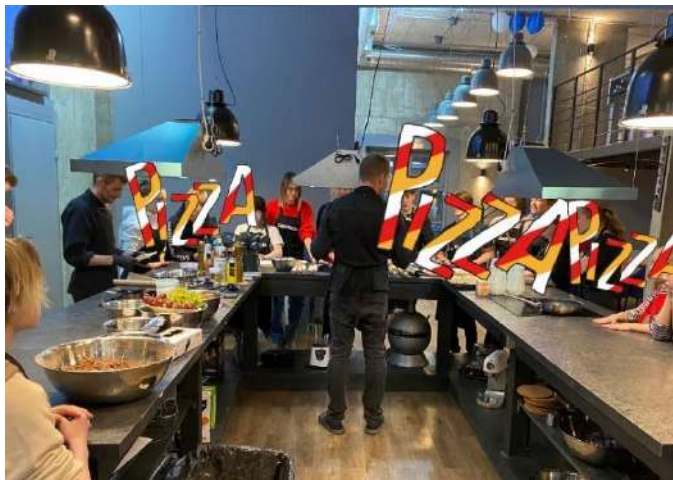
Кулинарная студия “Cookforia”

СПб ГБУ «Центр содействия семейному воспитанию № 6»