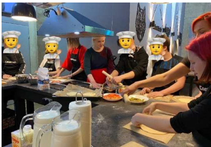
Пиццу, печенье или молочный коктейль мы теперь сделаем точно!