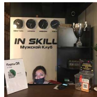
Приходя в IN SKILL можно пообщаться с мастерами и подстричься!